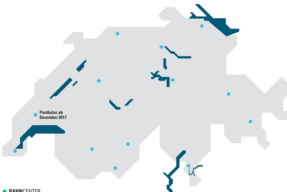
Karte mit den Bahncenter der Planzer-Gruppe

Planzer ist seit 1981 im Schienengüterverkehr tätig. Ein Meilenstein dabei war die Übernahme des Unternehmens Cargo Domizil der SBB durch Planzer und zwei andere Spediteure im Jahr 1996. Mit der Einführung der LSVA im Jahr 2001 entstanden günstigere Rahmenbedingungen, um den Schienentransport in der Schweiz zu einer rentablen Aktivität zu machen. Heute werden dank der Strassen/Schienen-Dienstleistungen und -Infrastrukturen von Planzer jährlich mehr als 36 000 Fahrten und 6300 Tonnen CO 2 eingespart.